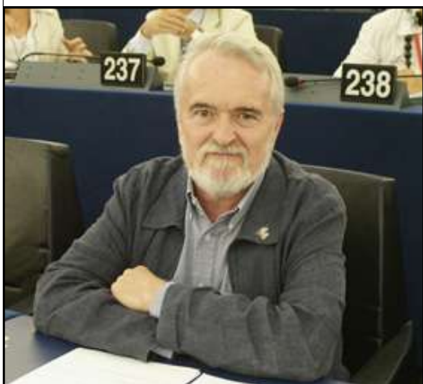
El alcazareño Miguel Ángel Martínez , actual eurodiputado socialista español, vicepresidente del Parlamento Europeo y nº 5 en la lista del PSOE

Los diputados del Parlamento Europeo se eligen cada cinco años por los ciudadanos mayores de edad de la Unión Europea en votación libre, directa y secreta. En total tienen derecho a voto unos 375 millones de personas de los casi 500 millones que vivimos en los 27 países de la Unión. Se trata, pues, de la segunda mayor elección del mundo (la primera es la de la India, donde habitan unos mil cien millones de personas).