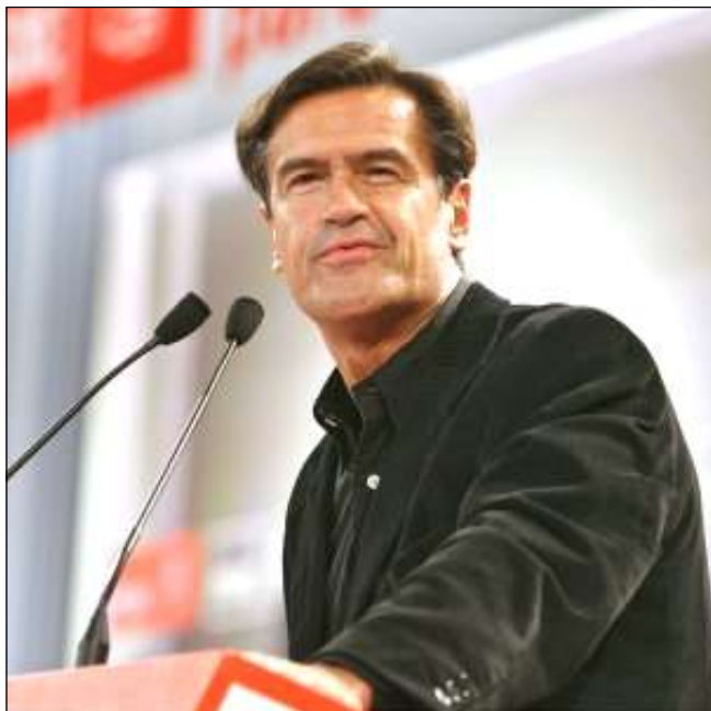
Juan Fernando López Aguilar , cabeza de lista del PSOE al Parlamento Europeo

A menudo, las elecciones al Parlamento Europeo despiertan escaso interés en los electores: Bruselas y Estrasburgo están lejos y parece que la cosa no va con nosotros. Incluso, como se tiene la sensación de que estas nos son elecciones importantes, mucha gente aprovecha para dar un toque de atención (una especie de pellizco de monja en forma de voto de castigo) al gobierno del propio país. Sin embargo, las elecciones europeas sí son importantes porque muchas de las cosas que nos afectan en el día a día se deciden en Europa. No hay, pues, excusa que valga. Los ciudadanos nos tenemos que tomar con interés las elecciones Europeas, y los socialistas más. Dice Juan Fernando López Aguilar, el número uno de la candidatura del PSOE, que no votar en esta ocasión es votar al PP o ralentizar la Europa del futuro.